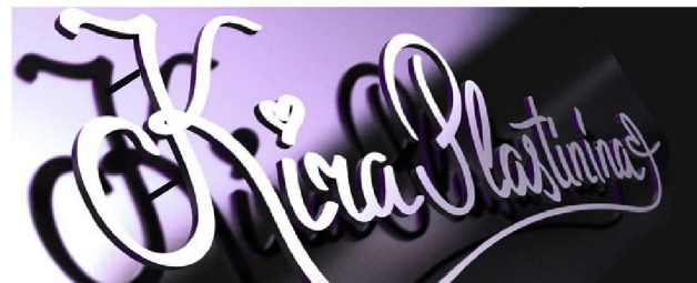
плоские ( псевдообъемные ) буквы