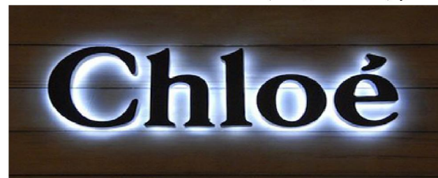
объемные буквы с контражурной подсветкой