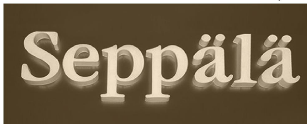
объемные буквы с внутренней светодиодной подсветкой